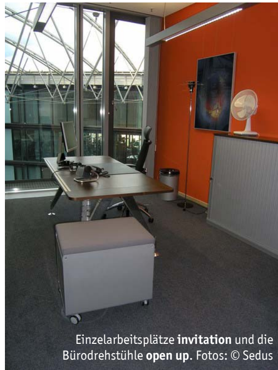
Einzelarbeitsplätze invitation und die Bürodrehstühle open up .

Anlässlich des Umzuges in die neue Frankfurter Firmenzentrale des Makler- und Consultingunternehmens wurde die Büroetage des ovalen Baus in der Baseler Strasse einer Generalsanierung unterzogen. Die Arbeitsplätze der 40 Mitarbeiter, teils in Einzel-, teils in Kombibüros, sind entweder durch den Innenhof oder die Außenfassade des Gebäudes natürlich belichtet. Intensive Wandfarben in Rot- und Grüntönen schaffen eine warme und kraftvolle Atmosphäre.